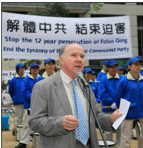
澳洲国家公民委员会主席彼得·韦斯莫

术可以立即进行，如果出了差错，两周之内将提供新的器官！我下意识地反应：这是不可能的，谁也做不到这一点！我本人来自医学背景，我好几个亲兄弟都是医生，移植器官要严格的组织配型，所以我知道，在以良好的医疗制度著称的澳大利亚，如果一