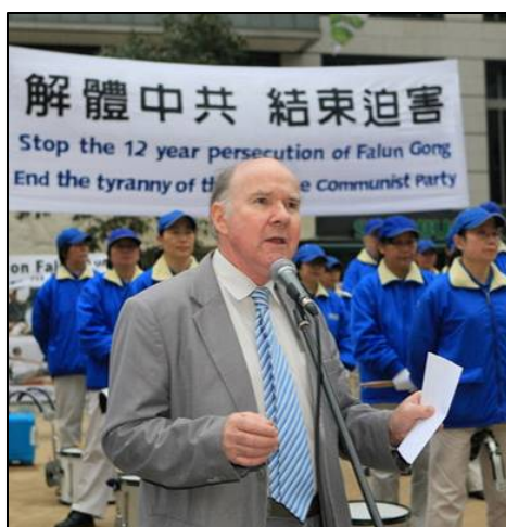
澳洲国家公民委员会主席彼得·韦斯莫

术可以立即进行，如果出了差错，两周之内将提供新的器官！我下意识地反应：这是不可能的，谁也做不到这一点！我本人来自医学背景，我好几个亲兄弟都是医生，移植器官要严格的组织配型，所以我知道，在以良好的医疗制度著称的澳大利亚，如果一