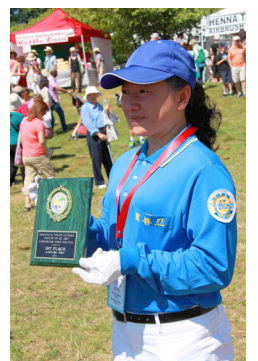
法轮功学员获得军乐队类表演一等奖

击掌表示感谢和鼓励，更多的市民纷纷鼓掌和拍摄法轮大法的游行队伍。当法轮功的游行队伍走过主席台时，主持人在介绍了法轮大法后说，他们如此出色，让我们一起为法轮功热烈鼓掌。