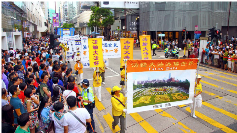
图：二零一四年七月十九日、二十日香港法轮功学员连续两天举行声势浩大的反迫害大游行，呼吁解体中共、结束迫害、法办元凶。香港多位立法会议员到场支持，大陆游客纷纷围观、拍摄，深受震撼。