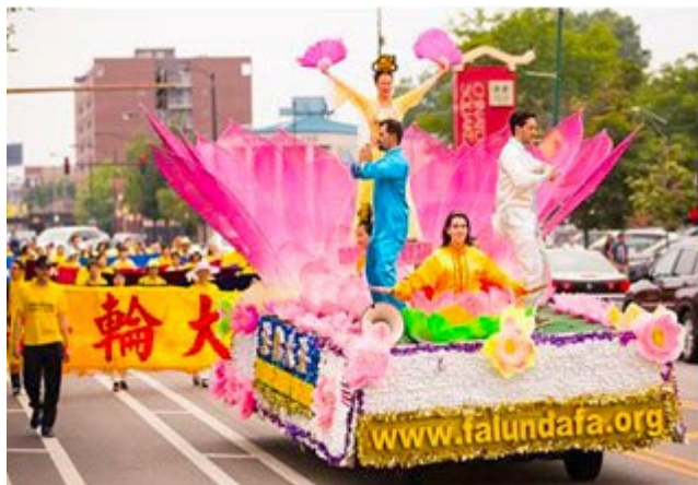
图：二零一四年七月二十六日，来自美国中部地区十个州的法轮功学员聚集芝加哥中国城，展开声势浩大的游行活动。当天，中国城的居民和各族裔游客都目睹了游行的宏大场面，倍感震撼。