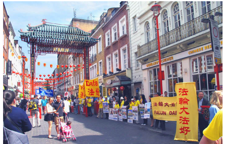
英国伦敦唐人街上的“真相长城”（2014年7月）

相活动，如果你们到了那里，可要多看看真相资料呀，也别阻拦孩子们看，这是他们的权利，对吧？