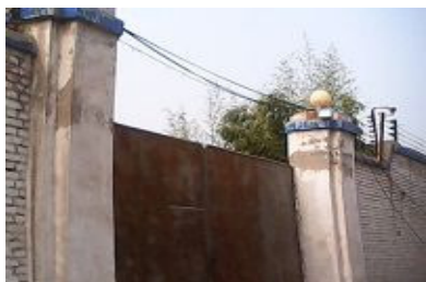
▲没名没牌的邢台洗脑班常年紧闭的大铁门

【明慧网通讯员河北报道】河北邢台“610”洗脑班，位于邢台东环路癫痫病医院东行三百米，静庵村村口，原第二看守所西侧。那里是迫害法轮功学员的黑监狱，高墙铁网，大铁门常年紧闭。多年来，那里摧残了众多法轮功学员，有的人被迫害致死，有的被迫害致精神失常。