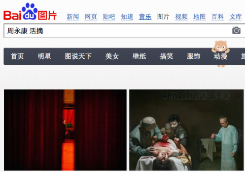
■在“百度图片”搜索“周永康 活摘”，可以看到揭露中共活摘法轮功学员器官的绘画。

据海外媒体报道，加拿大人权律师大卫·麦塔斯和前亚太司司长大卫·乔高共同撰写了一份调查报告。报告显示，2000年到2005年的6年间，在中国境内进行了6万个器官移植手术，其中41500个移植手术器官来源无法解释。这个报告中有52种证据证明，中国法轮功学员的器官被活体摘取用于移植手术。◇