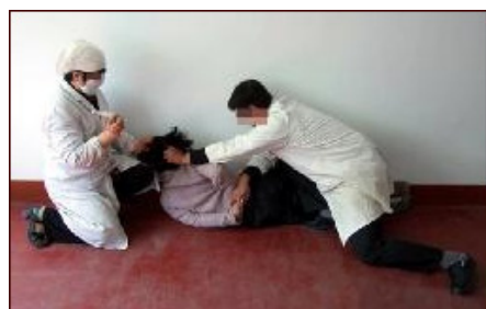
酷刑示意图:▲打毒针 ▼灌食