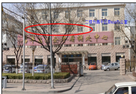
左图/二楼是昌平区委 610 办公室；右图/朝凤庵洗脑班外景（没有任何标志）

高崖口洗脑班成立于 2000 年初，有当时的 610 办公室大头子王振华（女，昌平本地人）、二头子梁士强（昌平本地人，现昌平区副区长，主管昌平区政法委）主管，当时还有 610 办公室恶人康丽（女，昌平本地），孙爱平（女，昌平本地，祖籍山东），廉学玉（现 610 科长，祖