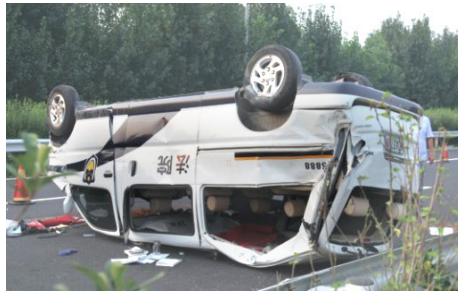
鲁山县法院的金杯警车四轮朝天