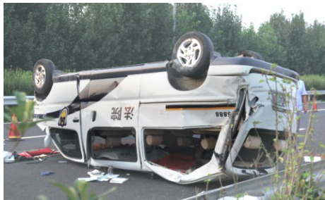
鲁山县法院的金杯警车四轮朝天