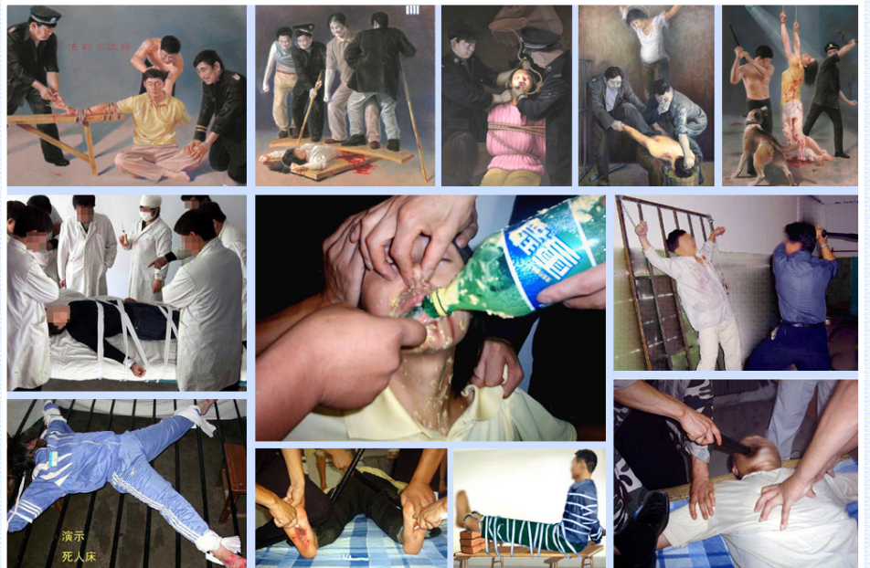
中共监狱、劳教所、看守所里酷刑迫害法轮功学员，受害者死里逃生之后，用文字、绘画或照片等方式再现和揭露暴行，以制止中共对更多无辜百姓的迫害。