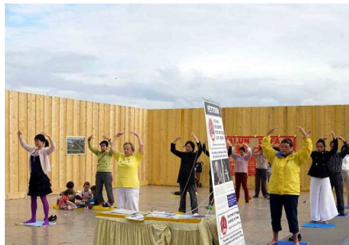
图：在人权广场演示法轮功功法拍照，还索要中文版的《真相报》和《九

评共产党》。一名游客拿了真相报后，学员要给他《九评共产党》，他说早看过了，去台湾的时候就得到了。