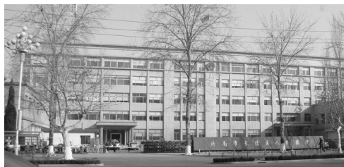
济南市长清区法院