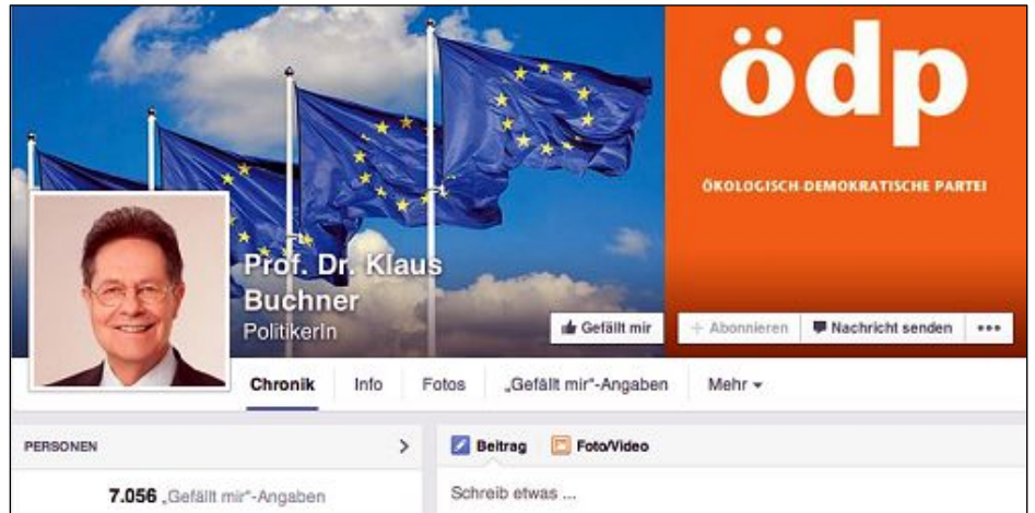
欧洲议会人权委员会议员克劳斯·布赫讷（Klaus Buchner）的脸书截图

第二天，他们遭到建三江市警察绑架，四律师被戴黑头套及酷刑折磨，共被打断 24 根肋骨，唐吉田律师一人被打断 10 根肋骨。他向媒体透露，在被暴打过程中，他被恶警威胁说，要