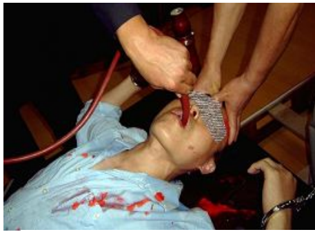
酷刑演示：野蛮灌食

山东省监狱十一监区恶警为了在精神上摧残法轮功修炼者，费尽心思采用过种种下流手段。十一监区要购物就必须得写购物申请（这个规定主要是针对法轮功学员，对其它服刑人员就是走形式），而且要求必须在购物申请开头写上“尊