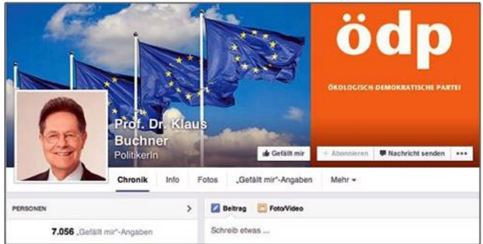
欧洲议会人权委员会议员克劳斯·布赫讷（Klaus Buchner）的脸书截图

第二天，他们遭到建三江市警察绑架，四律师被戴黑头套及酷刑折磨，共被打断24根肋骨，唐吉田律师一人被打断10根肋骨。他向媒体透露，在被暴打过程中，他被恶警威胁说，要