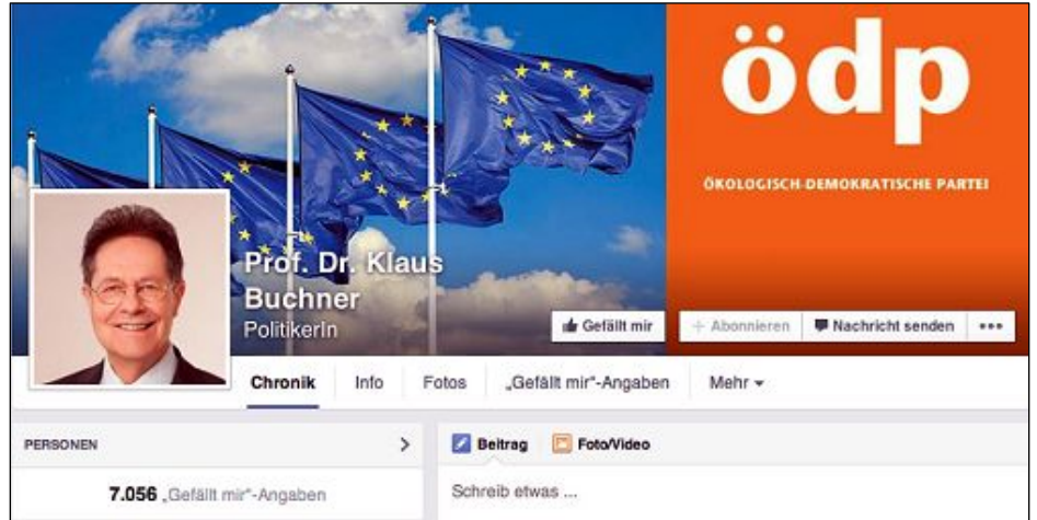
欧洲议会人权委员会议员克劳斯·布赫讷（Klaus Buchner）的脸书截图

第二天，他们遭到建三江市警察绑架，四律师被戴黑头套及酷刑折磨，共被打断 24 根肋骨，唐吉田律师一人被打断 10 根肋骨。他向媒体透露，在被暴打过程中，他被恶警威胁说，要