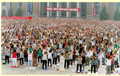
中共发动迫害之前，法轮功学员在大陆集体炼功的场面随处可见，图为沈阳法轮功学员集体炼功。