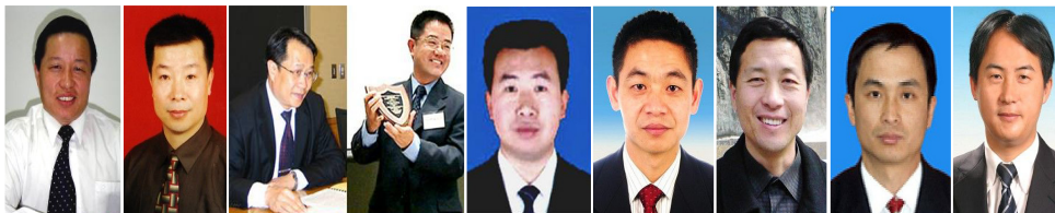
고즈성 리쑤빈 모사오핑 귀귀딩 장텐용 리쑹빙 탕지텐 세옌이 리허펑