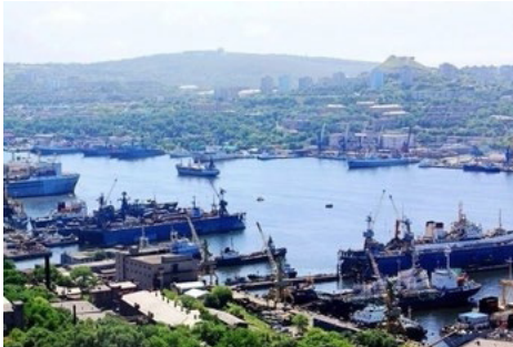
原是中国固有领土的天然不冻港海参崴

海参崴，太平洋岸畔的世界名城，天然的不冻港，因盛产海参而得名，原是中国固有领土，后被俄国侵占。中华民国蒋介石政府力主收复海参崴，1945年2月抗战胜利前夜，与苏联政府签订《中苏友好同盟条约》，明确海参崴将于50年后归还中国。