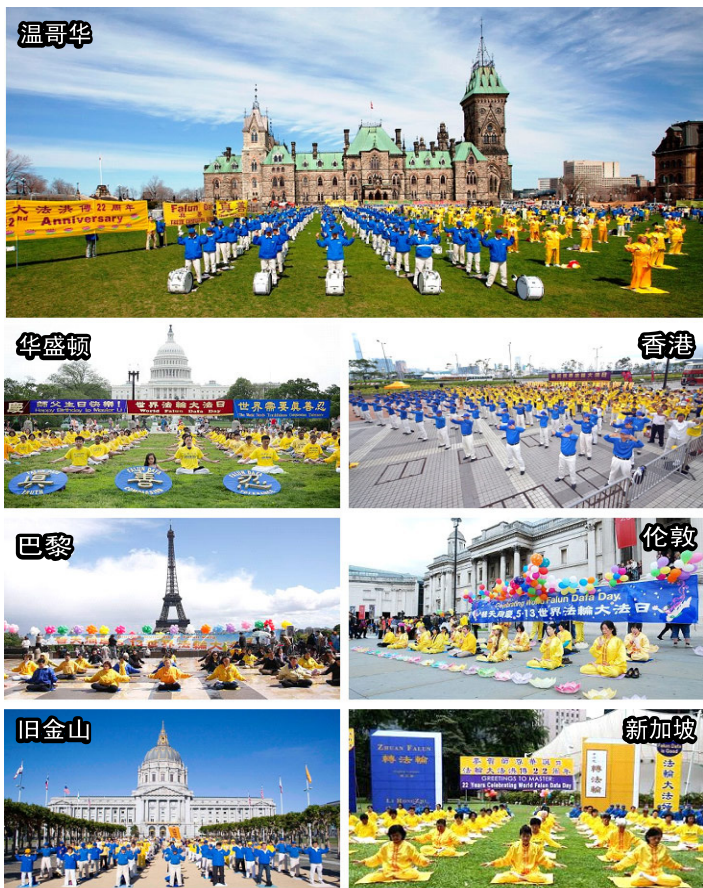
世界各地法轮功学员集体炼功精选

可是，修炼人并没有像我一样束手无策，我家很快添置了电脑和打印机，揭露事实真相的传单被打印出来传到千家万户。