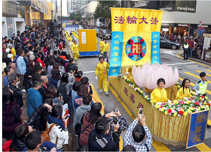
图：香港学员举办游行活动，和平理性反迫害，触动华人心。法轮功阵容庞大整齐的游行队伍吸引中西游客及港民驻足观看，纷纷举起相机、手机拍照。

下午二点，千名法轮功学员组成的游行队伍，分为“良知觉醒 解体迫害”、“和平理性反迫害”、“扬正气 祛妖狼”、“九评神威 天