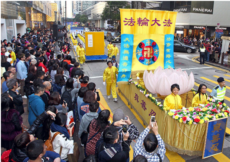
图：香港学员举办游行活动，和平理性反迫害，触动华人心。法轮功阵容庞大整齐的游行队伍吸引中西游客及港民驻足观看，纷纷举起相机、手机拍照。

【明慧网】二零一五年一月十七日，香港法轮大法修炼心得交流会的前夕，港、台、日、韩及东南亚等地的法轮功学员齐聚香港九龙，举行以“良知觉醒、解体迫害”为主题的传真相反迫害的集会游行活动。上午的集会结束后，随即进行“良知觉醒、解体迫害”传真相反迫害大游行。