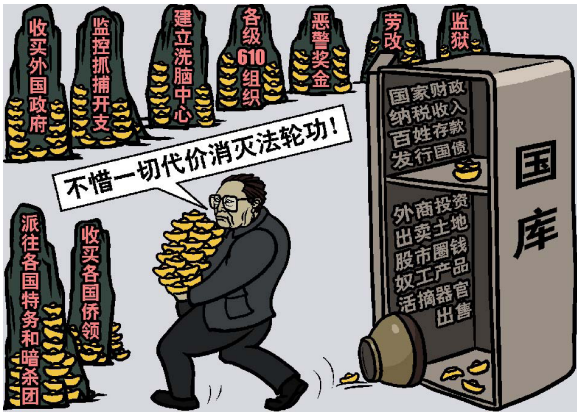
■ 江泽民罗干集团倾国之力迫害法轮功，制造了巨大的财政黑洞。

自 2009 年起，中共在包括迫害法轮功在内的国内所谓的“维稳”经费连续 5 年超过军费预算开支，据中共公布的数据显示，中共的维稳经费在 2009 年达 5140 亿元，接近军费开支数目；从 2010 年起，中共每年的维稳经费都超过军费开支，到 2013 年维稳经费为 7691 亿元，军费为 7406 亿元，超过军费近 300 亿元。2014 年，中共国防预算比前一年提高 12.2%，达到 8109 亿人民币；而“维稳”这个一直高于军费开支的费用，被当局有意“忽略”。