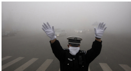
■ 中国大部分地区雾霾严重，交警在路上指挥交通。

人们不禁要问，中国这是怎么了？为什么灾祸愈演愈烈？为害日甚？其实中国古人早已给出了答案。古人认为，天灾与人祸是紧密相连的，天灾是由人祸而起。古人的“天人合一”观认为，人与大自然是一个密不可分的整体，这个整体的局部出现了问题，