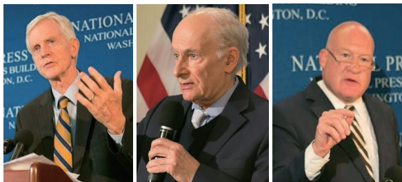
■ 大卫·乔高 大卫·麦塔斯 伊森·葛特曼

加拿大外交部亚太司前司长大卫·乔高（David Kilgour）与加拿大著名国际人权律师大卫·麦塔斯（David Matas）组成的独立调查组，2006 年 7 月 6 日公开了调查报告，结论是“大规模的、违背意愿的、对法轮功修炼者的器官掠取一直存在且在继续着”。并称之为“这个星球上前所未有的邪恶”。报告被译成 18 种语言，第三版累计 52 种证据方法佐证，成书《血腥的活摘器官》。