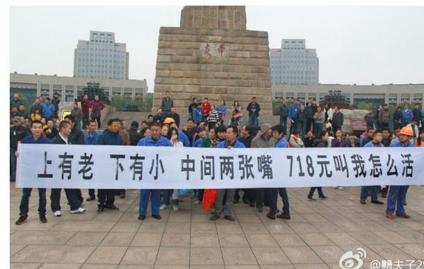
■ 中国民众在抗议示威企业关闭后的低额补助。

在中国其实每个人都是纳税人，中国的税赋高居全球第二。纳税人的根本权利就是享受优质的教育、医疗、社会保障、就业等等公共服务，但我们只是被强制纳税，却从来不知道所纳税的去向。有人说，我们中国人纳世界上最多的税，中共却用巨资来所谓“维稳”，等于我们自己拿钱来对付我们自己。