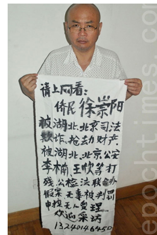
■ 徐崇阳要求在薄熙来案件中出庭作证，指控薄熙来酷刑对待他。