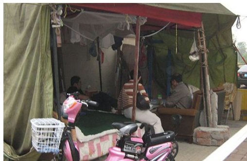
■ 济南槐荫区强拆民房，受害人街头搭棚度日。

2010年12月4日，济南槐荫区政府动用上千警察非法暴力强拆金鑫苑小区，在强拆前，任何手续都没有，也没有补偿。这些拆迁户到法院起诉，法院不立案。后又被强制与槐荫区政府签订不合理的拆迁补偿协议，槐荫区政府说他们要是不签名就按法轮功的人处理。