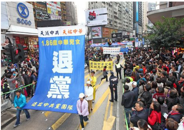
二零一四年十二月七日，法轮功学员在香港举行盛大的游行纪念《九评共产党》发表十周年