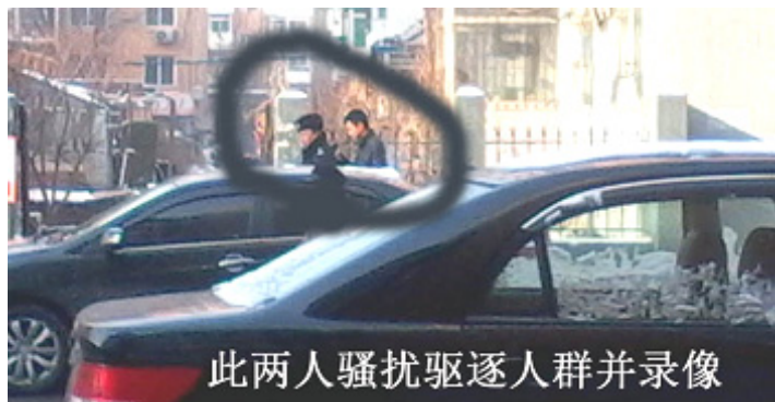
此两人骚扰驱逐人群并录像

他们司法拘押。于溟家人则去法院附近派出所就法警殴打老人报案，派出所推脱不管。辩护律师把庭审经过发到了微博上，一位律师在微博上评论说：“法院程序全部违法，当事人当庭晕倒，法警暴力执法，当事人母亲七、八十岁老人家被法警殴打，当事人亲属被抓，这是法院？还是匪窝？”