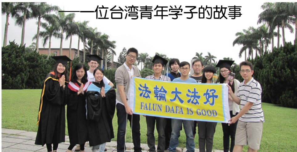
张嘉升（右一）参加青年学子的毕业典礼并合照留影