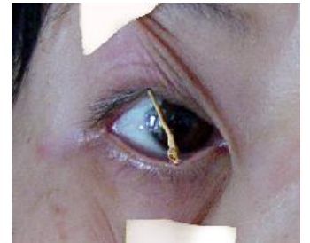
牙签支眼皮不让睡觉

将该监狱非法关押的三十三名法轮功学员集中劫持在“严管队”,实施各种非人酷刑,转化这些法轮功学员。所采用的酷刑手段已知有如下几种: