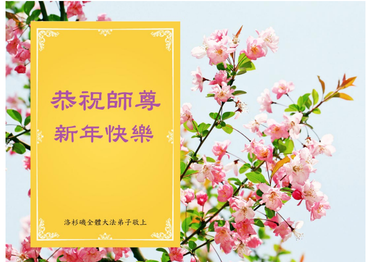
图：美国洛杉矶大法弟子恭祝师尊新年快乐贺卡