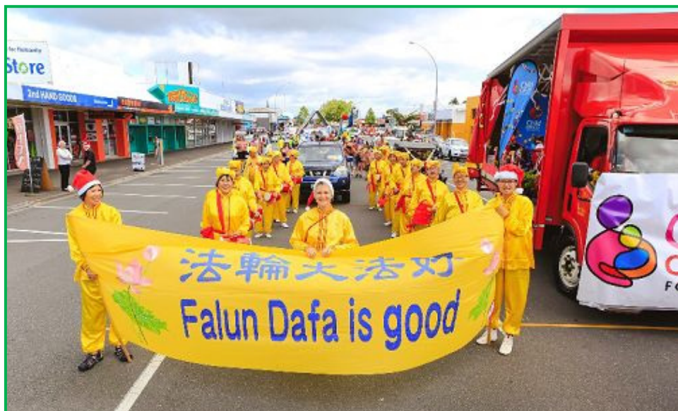
图：法轮功学员打着法轮功大法好的条幅在游行的队伍中行走，显示法轮功美好的风貌。他们身着明黄色丝绸队服，佩戴红色腰鼓，随着“法轮大法好”的乐曲声击鼓起舞，神采奕奕。

一位华人女士从基督城刚搬来陶朗加居住。游行开始前，她一见到天国乐团就主动地和法轮功学员打招呼，还十分开心地说：“我以前就见过你们，今天又见到了！”腰鼓队在游行中也备受瞩目。队员