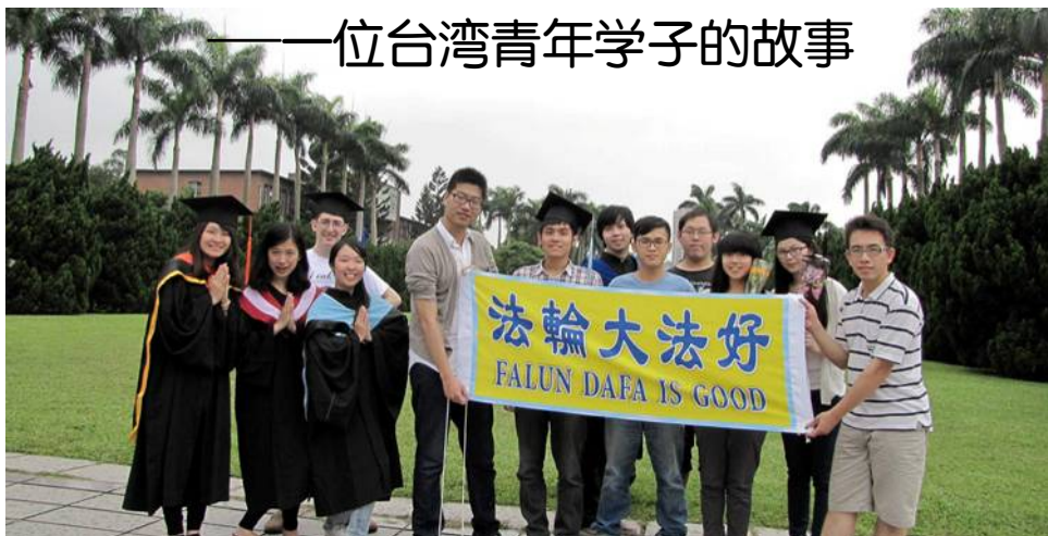
张嘉升（右一）参加青年学子的毕业典礼并合照留影