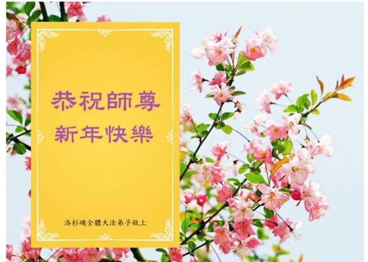
图：美国洛杉矶大法弟子恭祝师尊新年快乐贺卡