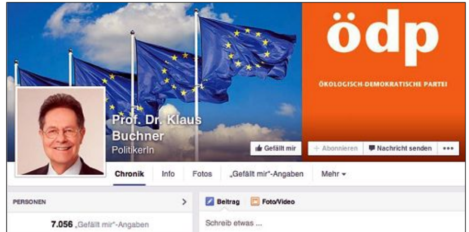
欧洲议会人权委员会议员克劳斯·布赫讷（Klaus Buchner）的脸书截图

第二天，他们遭到建三江市警察绑架，四律师被戴黑头套及酷刑折磨，共被打断24根肋骨，唐吉田律师一人被打断10根肋骨。他向媒体透露，在被暴打过程中，他被恶警威胁说，要