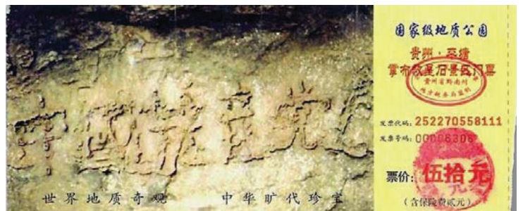
2002년 6월 구이저우에서 발견된 ‘장자석’ 단면에 ‘중국공산당망’이란 6개의 큰 글자가 나타나 ‘천멸중공(天滅中共)’이라는 천기(天機)를 알려 주고 있다.

또 동유럽, 옛 소련 등 그렇게 많던 사회주의 국가의 공산당이 무너진 것은 중국공산당의 집권도 반드시 무너진다는 것을 실천적으로 증명하고 있다.