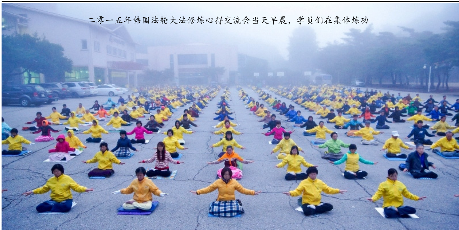
二零一五年韩国法轮大法修炼心得交流会当天早晨，学员们在集体炼功