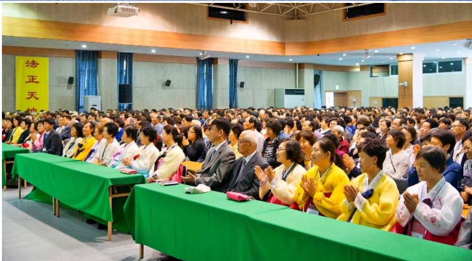
二零一五年韩国法轮大法修炼心得交流会现场

他为赶上大巴每个站点的时间，往往开车过猛，且不允许出租车、轿车等插进来。由于他性格急躁，经常违反交通规则。一天，他突然想起师父讲的“先他后我”的法理，就扪心自问：我做到先他后我了吗？出租车和轿车要插进来为什么就是不让呢？他们也是有急事才会这样做的。之后，再有出租车和轿车想插进来，他就让着他们，神奇的是，这样做以后，他的大巴路线就会畅通无阻，也更能遵守时间了。自那以后，他改掉了急躁的性格，开车先考虑对方。摆正心态后也就没有违反交通规则的情况了。