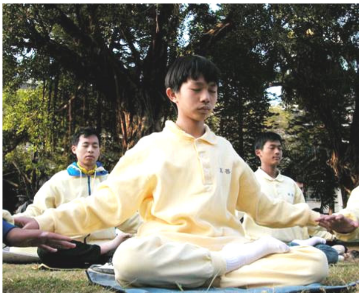
台湾成功大学的法轮功社团早于 2000 年成立，每周三晚上读法轮功书籍、在景色幽美的“榕园”成立炼功点。

向善的。不过，当时我有一些不解，为何这群修炼的人连死都不怕，也要做一个好人。因为当时，我是按照权斗与利益去衡量一切，拿这个标准去衡量人世间的一切事物，都能够有一个比较合理的说辞。但是拿这个标准去衡量法轮大法，却怎么也解释不通，法轮功实在是太正了。