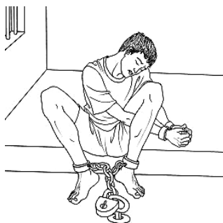
示意图：戴手铐脚镣冷冻