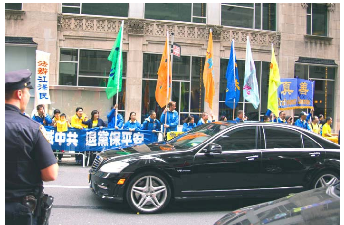
习近平的车队多次在法轮功学员打出的真相横幅前经过

在纽约，有近 300 名法轮功学员邮寄诉江起诉书到中国最高检察院和最高法院，其中大多数控告人都在国