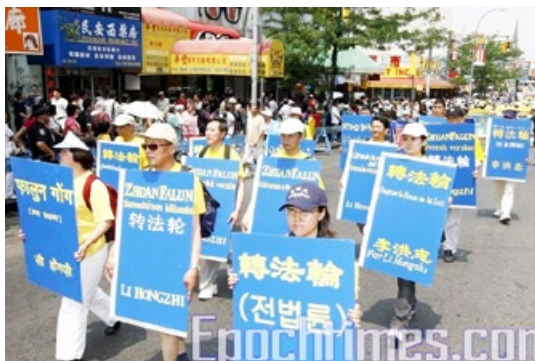
■ 现在《转法轮》一书被译成30多种语言出版发行

我去后重建规章制度，给他们讲做人的道理。我对他们说：“你们过去的事我不知道也不追究，我现在能做到的你们也必须做到，如果哪个以后违反规章制度和法律，依法按章处理。”我以诚相待，给他们讲人生哲学，讲善恶有报是天理，从心灵上改变他们。错事不讲情，小事不违规，私事