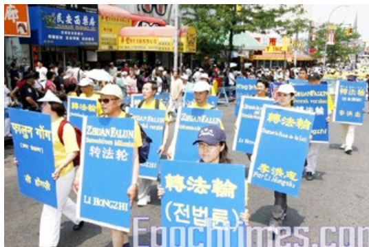
■ 现在《转法轮》一书被译成30多种语言出版发行

1995年5月是我生命中的转折点，我永生难忘。朋友的女婿来找我办事，见我满书架都是佛经、道经、易经等书，就问：“叔叔，你喜欢佛道两家吗？”我回答说：“为活命找一条生路呀！”他说：“我有一本《转法轮》你一定喜欢，是你从未学过的上乘佛法。”我说：“好，你给我留下吧。”