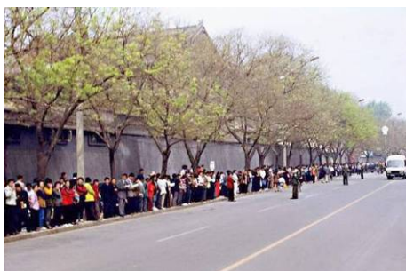
1999 年 4 月 25 日和平上访现场。中共迫害在先，法轮功学员上访在后。

文章还报道说，法国著名律师 William Bourdon 认为，针对江泽民的司法行动可望在国际社会，如欧洲、美国等地展开。◇