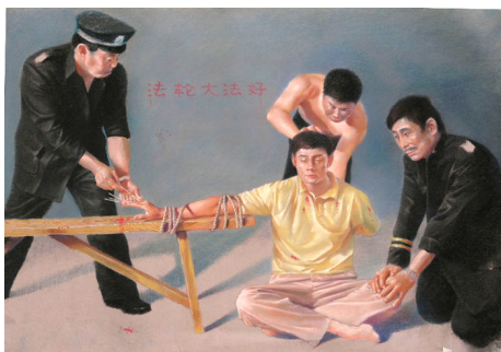
酷刑图示：用竹签扎手指（绘画）

在龙泉驿区看守所，狱警指使、纵容犯人对我的重重折磨：在寒冬剥光我的衣服，反复用冷水浇灌；十余犯人轮流毒打，致我大量吐血；用竹签从我左手食指、中指之间插入，从手掌刺出；用三个点燃的烟头同时烫我左脸。为抗议这种非人虐待，我绝食绝水三天。第四天，狱警对我强行灌食。此后，他们逼我从事高强度劳作（手工制作针药盒），每天 14 个小时以上。为示抗议，我坚持不做，