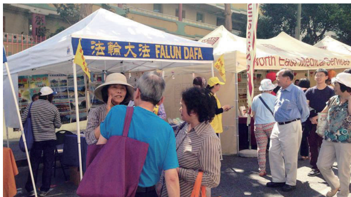
많은 중국인이 걸음을 멈추어 진상을 확인하고 '3퇴' 했다.

적지 않은 사람은 파룬궁이 무엇인지를 물었다. 파룬궁 수련생은 파룬궁이 '진(真), 선(善), 인(忍)'에 따르도록 가르치는 불가의 수련대법이라는 것과 사람들에게 '진, 선, 인'이 필요함을 알려 주었다. 많은 사람이