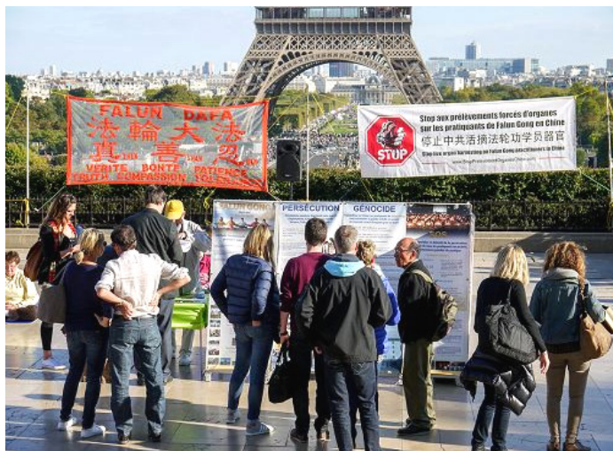
巴黎景点上，游客观看法轮功真相展板。

他又接着说：“你别说，法轮大法真是神奇，自从我在电话上听他们讲三退，我退出以后，念‘法轮大法好，真善忍好’，我就没病过，