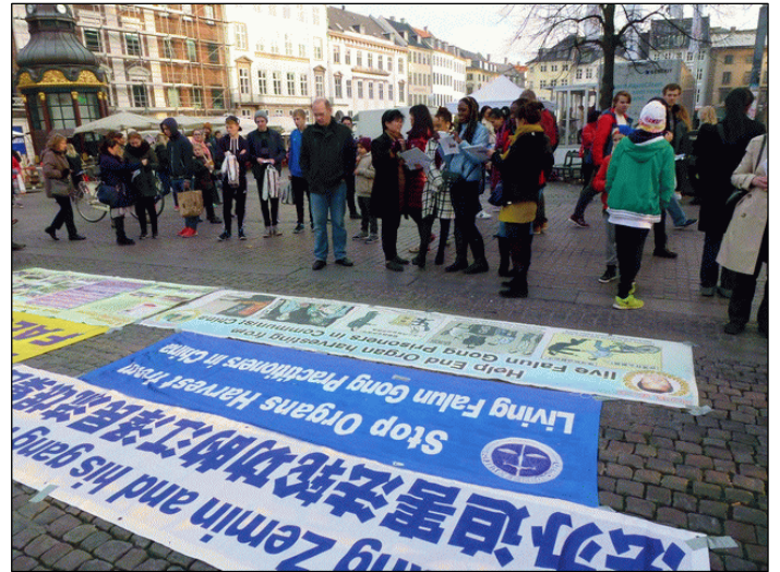
图：哥本哈根市中心的老广场上，人们认真阅读法轮功真相

不断地迫害本国民众。受迫害的，法轮功之前是八九‘六四’的学生，之前是文革，再之前是‘四清’、‘三反’、‘五反’，‘反右’，哪次不是中共的问题？”