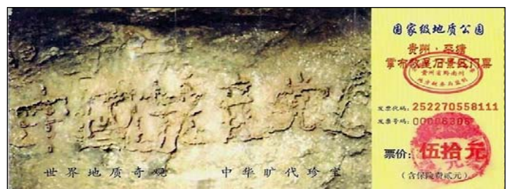
图：2002 年 6 月在贵州发现的“藏字石”断面上显现“中国共产党亡”六个大字，昭示着“天灭中共”的天意。