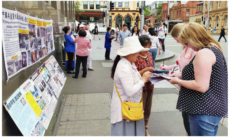
图：明白真相的澳洲市民纷纷在制止“活摘”和声援诉江的征签表上签名支持法轮功学员反迫害

周六正午时分，穿梭不息的过路人走过法轮功真相横幅前，有的驻足了解真相；有的在声援中国法轮功学员控告迫害法轮功元凶江泽民和制止“活摘”器官的征签表上签名支持，