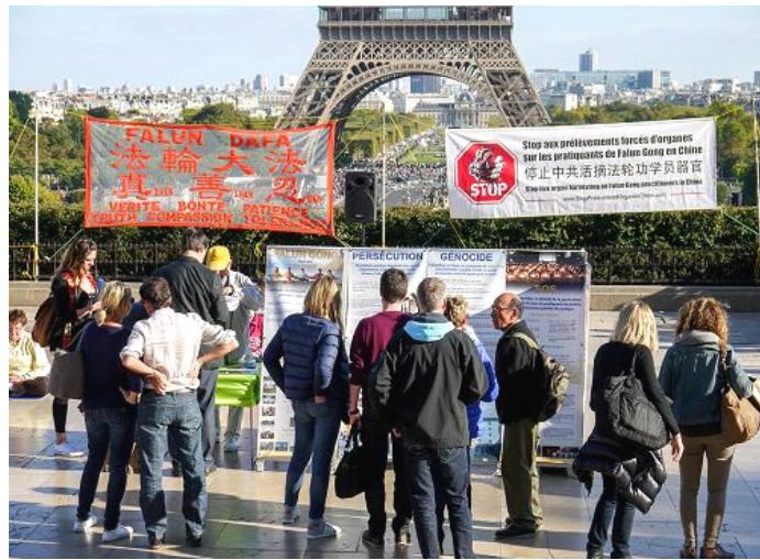
巴黎景点上，游客观看法轮功真相展板。

他又接着说：“你别说，法轮大法真是神奇，自从我在电话上听他们讲三退，我退出以后，念‘法轮大法好，真善忍好’，我就没病过，