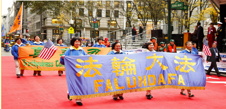
法轮功学员参加纽约“老兵节”游行。

用海外电子信箱给 freeget.ip@gmail.com 发电子邮件(标题不可空白), 10 分钟内会拿到几个 IP 地址。在动态网主页请下载自由门、无界等各种“翻墙”软件, 以后通过该软件上网更方便。