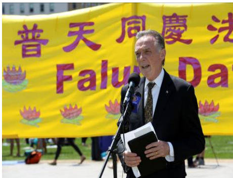
■ 国会议员、加拿大国会法轮功之友主席彼得·肯特

他在声明中说：从 1999 年开始，江泽民发动了对法轮功的残酷迫害。这场残忍的、致命的、接踵而来的凌驾于司法之上的打压运动，2006 年被充分地记载于乔高和麦塔斯的报告中，其内容在 2009 年出版的《血腥的活摘器官——为掠夺器官谋杀法轮功学员》中被进一步更新。