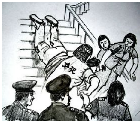
中共酷刑示意图：拖拽

自己家中被突闯民宅的警匪劫持，那么“在逃”之说从何而来？！而且她是按真、善、忍原则修持自己的好人，绝不是犯人，更没有理由逃亡。《宪法》规定“公民信仰自由”“公民人身自由不受侵害”，是公安警察在公然践踏宪法。