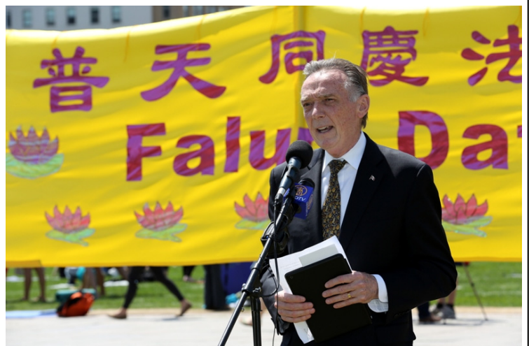
国会议员、加拿大国会法轮功之友主席彼得·肯特

◎2015年11月7日至8日，新西兰北岛芒加努伊山体育中心举办了健康生活节。当地法轮功学员在健康节上设立了一个摊位，向民众详细介绍法轮功，吸引了许多热爱健康生活的人们。有数十人当天注册要参加法轮功教功班。