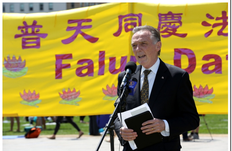
国会议员、加拿大国会法轮功之友主席彼得·肯特

◎2015年11月7日至8日，新西兰北岛芒加努伊山体育中心举办了健康生活节。当地法轮功学员在健康节上设立了一个摊位，向民众详细介绍法轮功，吸引了许多热爱健康生活的人们。有数十人当天注册要参加法轮功教功班。