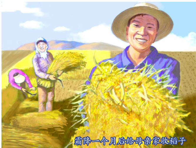
霜降一个月后给母亲家收稻子

了，只有我母亲家的稻子还又青又绿地站在田里。说也奇怪，霜降的日期都已经过了，可那段时间的天气却一直都是风和日丽，我记得父亲总是乐呵呵地念叨着，希望能晚点下霜。没几天的工夫，上下几百亩的水稻都被