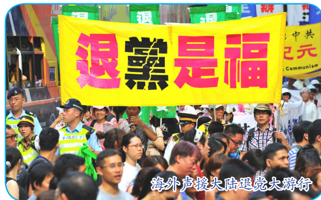
海外声援大陆退党大游行

“三退”也很简单，用真名、小名、化名都可以，用翻墙软件在大纪元网站退或者将“三退”声明贴到公共场所。老天看的是人心。◇