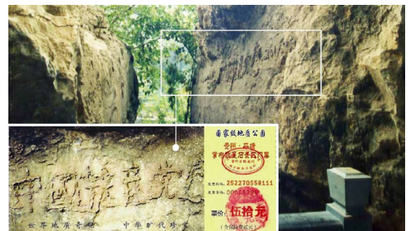
2002年，贵州平塘县掌布乡发现距今约2.7亿年的巨石，上显大字：中國共產党亡（左下图为风景区门票）

那么天灭中共的时候，那些发过毒誓把生命献给它、为它奋斗终生的党、团、队员们，就会成为它的陪葬品。退出中共是良心与正义的选择，是在给自己选择美好的未来。“三退”不是让您去组织内退，而是您向上天表态决裂这个邪恶组织，抹掉这个邪恶誓约。“三退”也很简单，用真名、小名、化名都可以，用翻墙软件在大纪元网站退或者将“三退”声明贴到公共场所。老天看的是人心。◇