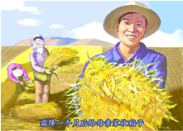
霜降一个月后给母亲家收稻子

就在母亲家的稻子收割完的一两天后，下枯霜了，气温骤然下降。屯子里的人对我父亲说：“你们家真是有缘分，老天爷真照顾你。”是啊，这是我们家修炼法轮大法后得到的福报。◇