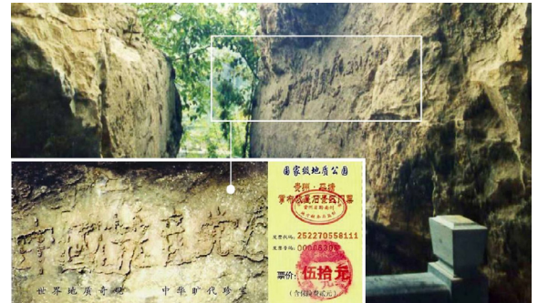
2002年，贵州平塘县掌布乡发现距今约2.7亿年的巨石，上显大字：中國共產党亡（左下图为风景区门票）

那么天灭中共的时候，那些发过毒誓把生命献给它、为它奋斗终生的党、团、队员们，就会成为它的陪葬品。退出中共是良心与正义的选择，是在给自己选择美好的未来。“三退”不是让您去组织内退，而是您向上天表态决裂这个邪恶组织，抹掉这个邪恶誓约。“三退”也很简单，用真名、小名、化名都可以，用翻墙软件在大纪元网站退或者将“三退”声明贴到公共场所。老天看的是人心。◇