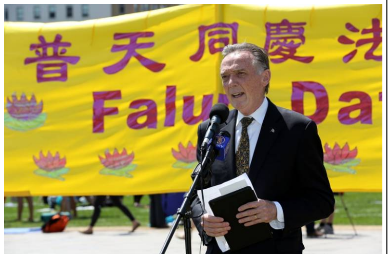
国会议员、加拿大国会法轮功之友主席彼得·肯特

◎2015 年 11 月 7 日至 8 日，新西兰北岛芒加努伊山体育中心举办了健康生活节。当地法轮功学员在健康节上设立了一个摊位，向民众详细介绍法轮功，吸引了许多热爱健康生活的人们。有数十人当天注册要参加法轮功教功班。