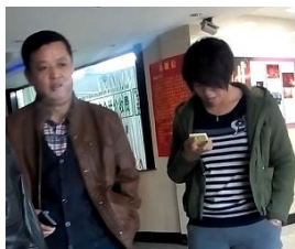
看守所所长与女警

躺在病床上, 穿着尿不湿, 生活完全不能自理, 脚上还戴着脚镣, 脚镣另一端锁在床帮上。律师质问他们, 人都这样了还给锁上, 难道还怕她跑了? 在场的人支支吾吾答不上来。